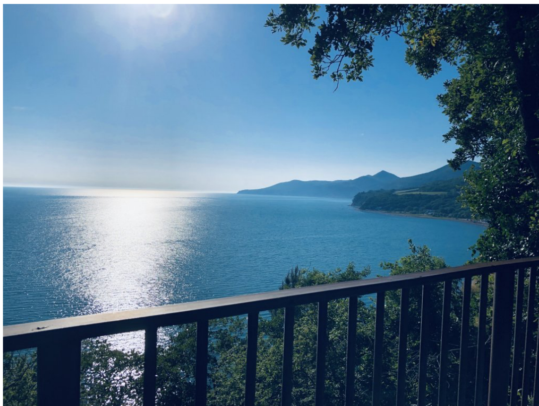
Вид со смотровой площадки нашего отеля.